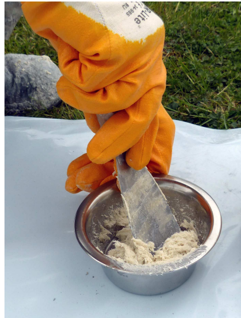
Für Risse an der Plattenunterseite sollte die angemischte Spachtelmasse zähfließend sein.

3. Anmischen der Spachtelmasse: Anschließend wird die Spachtelmasse aus dem gelieferten Reparaturset hergestellt.