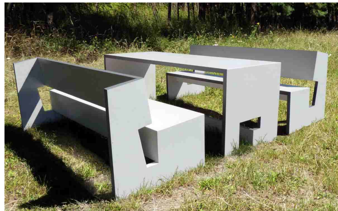
mineralit® - Parkbank; Sonderdekor: RAL 9001 cremeweiß

Unsere Parkbänke bieten die Möglichkeit, das ganze Jahr im Freien stehen zu können um den witterungsbedingten Einflüssen der Jahreszeiten zu trotzen und ohne langfristig Schäden am Material hervorzurufen.