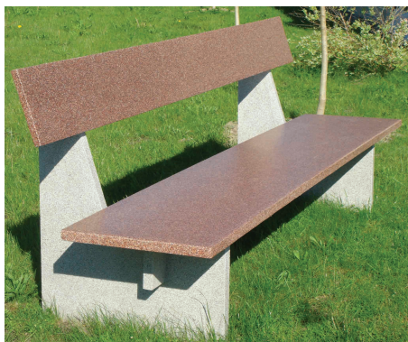
mineralit® - Sitzbank; Dekore: granit hell und monzonit

Ob Sitzmöbel, Tische, Pflanzschalen, Kombibehälter oder Verkleidungen verschiedenster Art, den Anwendungsmöglichkeiten von mineralit® - Platten-elementen sind keine Grenzen gesetzt.