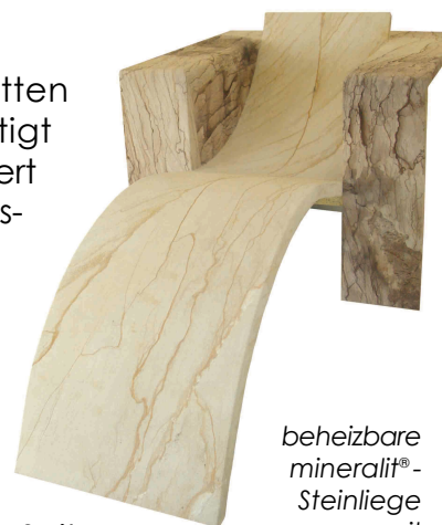
beheizbare mineralit®- Steinliege mit geschwungener Liegefläche

Gern stehen wir Ihnen bei der Ideenfindung zur Seite.