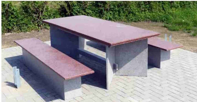
mineralit® - Sitzbank; Dekore: granit hell & monzonit

Die Ansprüche an Design und Architektur sind, sowohl im öffentlichen Raum als auch in privaten Gärten, besonders in Kombination mit funktionalen Objekten, mit der Zeit stetig gewachsen.