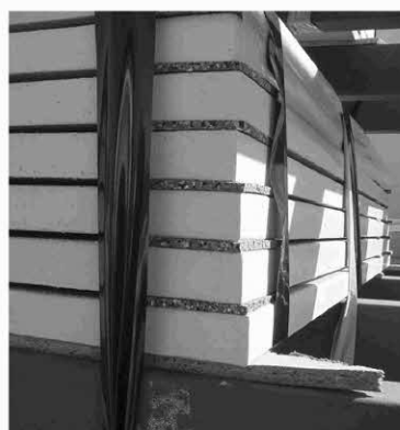
Antirutschmatten zwischen den Mineralit - Platten

Die Lagerung ohne Stahlleihpaletten erfolgt auf Kanthölzern (ca. 100 x 100 mm). Alternativ zu Kanthölzern können die Platten auch mit Gummigranulatmatten unterlegt werden. Maximal 10 Platten sollten dabei übereinander liegen. Die Kanthölzer (bzw. Gummigranulatmatten) sind so zu platzieren, daß die Ecken bündig mit den Kanthölzern abschließen. Bei Platten die größer als 2500 mm sind, sind mittig jeweils zwei zusätzliche Kanthölzer (bzw. Gummigranulatmatten) notwendig (siehe Grafik unten).