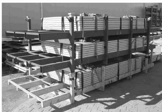
In Stahlleihpaletten verpackte Mineralit - Platten

Die Mineralit - Balkonbodenplatten werden in Stahlleihpaletten liegend versandfertig verpackt und ausgeliefert. Die Paletten müssen waagrecht auf ebenem, befestigtem, unbewachsenem Untergrund gelagert werden , damit ein durch falsche Lagerung bedingtes Verziehen der Platten vermieden wird. (siehe Fotos) Die Platten werden mit Antirutschmatten aus Gummigranulat gelagert, um transportbedingte Schäden zu vermeiden.